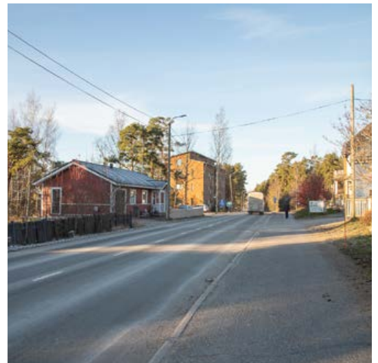
Onkkaalantie välillä Kankilantie – Syrjänharjuntie.

Kaavoituksessa osallisia ovat suunnittelualueen maanomistajat ja ne, joiden asumiseen, työnteekoon tai muihin oloihin kaava saattaa huomattavasti vaikuttaa, sekä viranomaiset ja yhteisöt, joiden toimialaa suunnittelussa käsitellään.