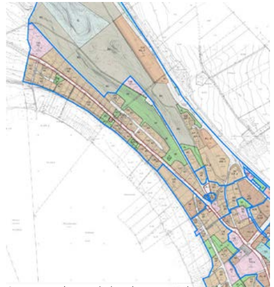
Ote asemakaavayhdistelmästä, pohjoisosa.