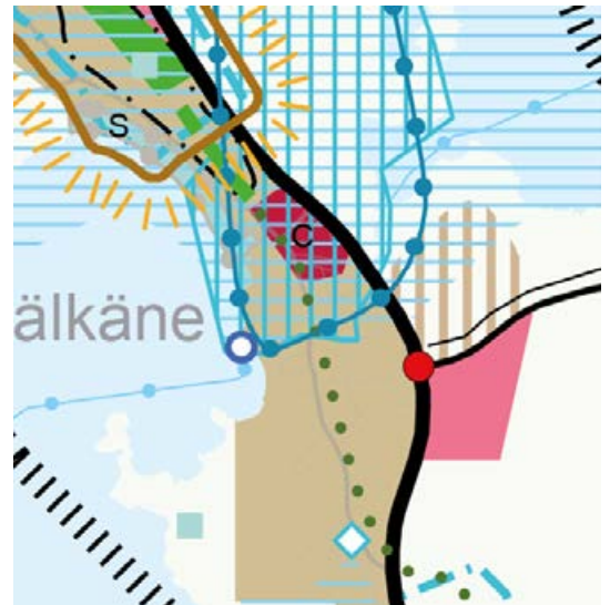
Ote Pirkanmaan maakuntakaava 2040:sta.

Katusuunnitelma laaditaan samaan aikaan asemakaavahankkeen kanssa siten, että tarvittaessa suunnittelun aikana esiin tulevat tarpeet voidaan huomioida asemakaavaa laadittaessa. Katusuunnitelma voidaan hyväksyä sen jälkeen, kun asemakaava on lainvoimainen.