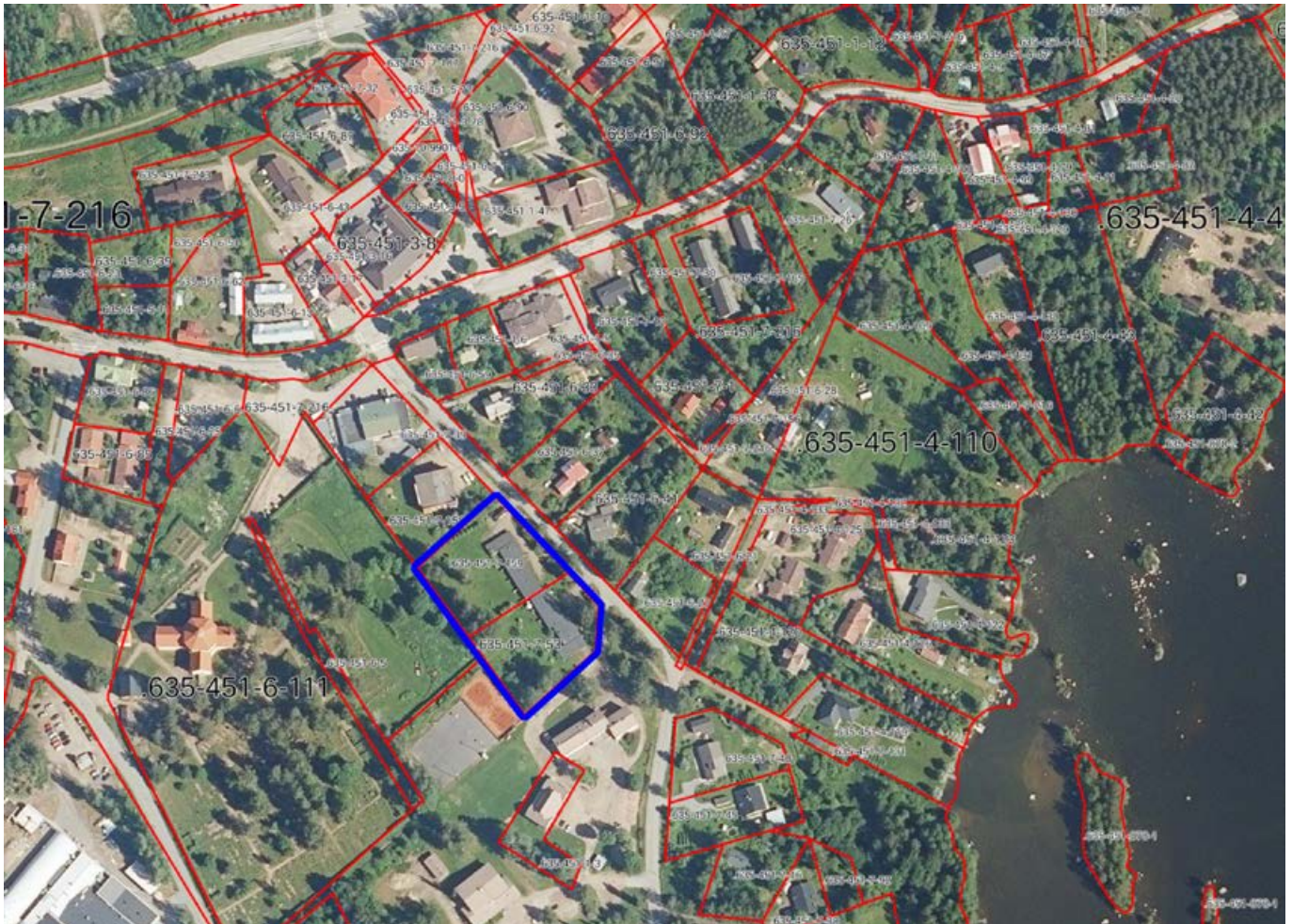
Suunnittelualueen sijainti ja rajaus. Suunnittelualue on rajattu sinisellä viivalla. Rajausta voidaan tarkistaa hankkeen aikana.

OSALLISTUMIS- JA ARVIOINTISUUNNITELMA 21.12.2021