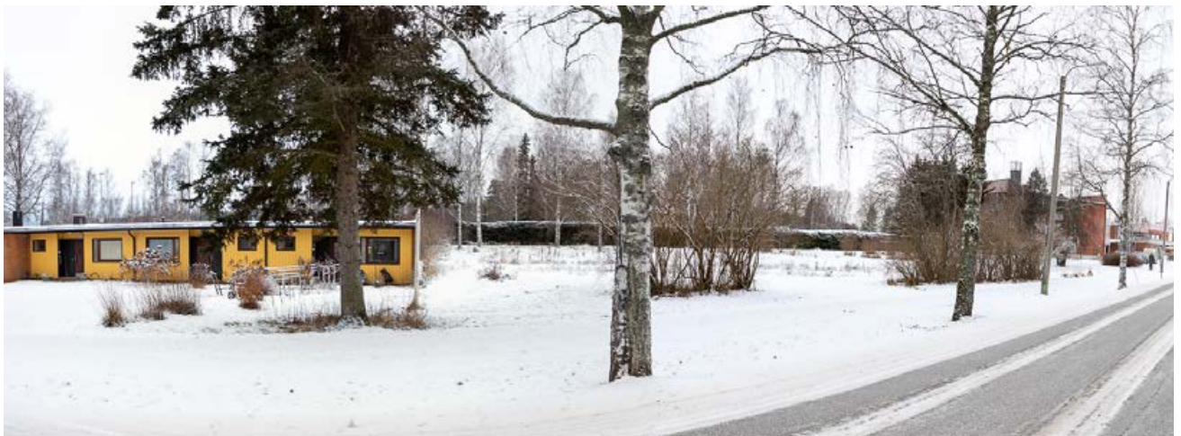
Suunnittelualue nähtynä Rajalantieltä.

Kaavaprosessin vaiheista ja nähtävillä olosta tiedotetaan ilmoittamalla Sydän-Hämeen lehdessä ja kunnan internetsivuilla.